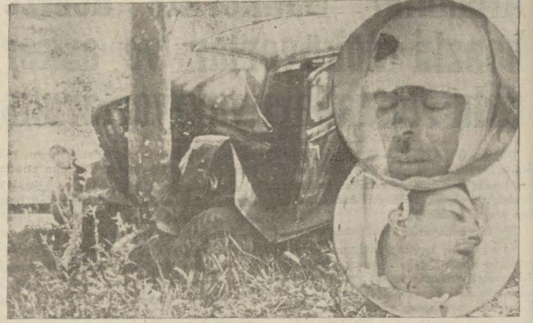
Kazazedelerden ikisi ve otomobilin hali