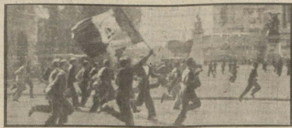
Romada müttefikler aleyhine yapılan nümayişlerden bir intiba: Nümayişçi gençler Venedik meydanına koşuyorlar

Almanlar müttefiklerin Dunkerk müstahkem ordugâhına her cihetten taarruzlarına devam ederek pek cüz'î ilerlemelerde bulunmuşlar ve Dunkerkin 10 Km. kadar cenubunda bulunan Berges mevkiini alabilmişlerdir. Aynı zamanda 7-8 kilometre derinlik ve sahilde 25 Km. kadar genişlikte bulunan müstahkem ordugâha, limana ve nakliyat yapan gemilere hem uçaklarla ta- (Devamı 3 üncü sayfada)