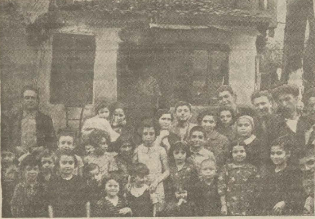
Zehirlenenlerden bir kısmı ve süt aldıkları dükkân

Hâdise, gizli bir süt tevzi istasyonunun sattığı bayat sütten çıktı, zehirlenenler derhal hastaneye kaldırıldılar